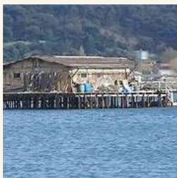
Les huîtres de Tamaris