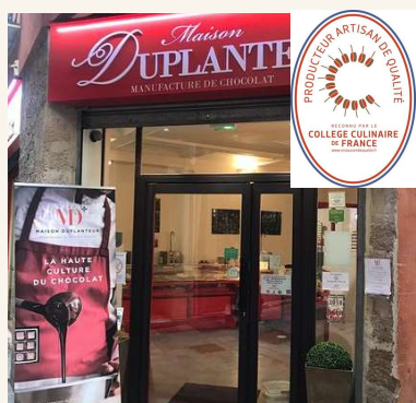
Le chocolat de la maison Duplanteur à Grasse