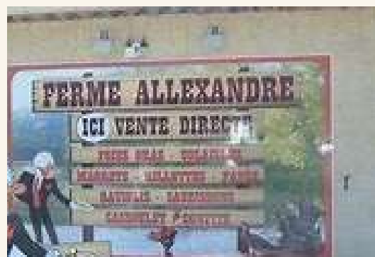
Foie gras de Callian