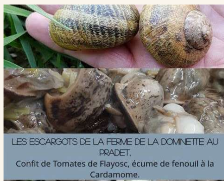
Les escargots du Pradet