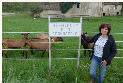
La ferme de la Pastourelle à Châteaudouble